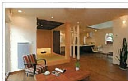
無害で安全なため吹きつけ作業も簡単

また同社では、トリニティーを扱う代理店を業界問わず募集している。詳細は問い合わせを。